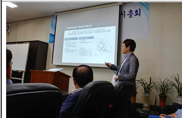
조합원 대상 설명회 개최(2018.09.05)