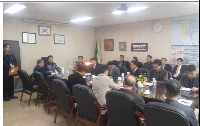
4차기관 합동회의 개최(2018.11.19)